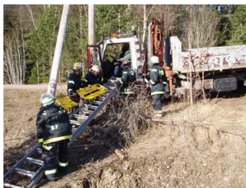
Skadad lastbilschaufför lyfts ut