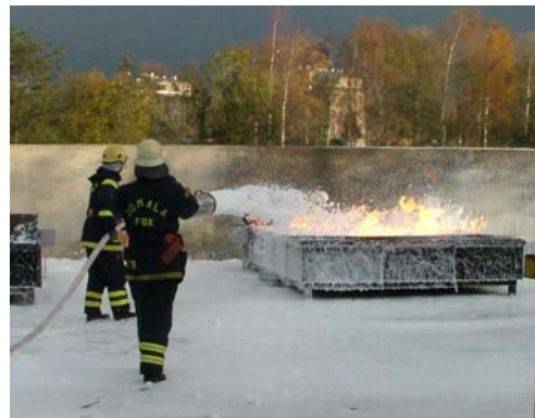
Kurs i skumsläckning