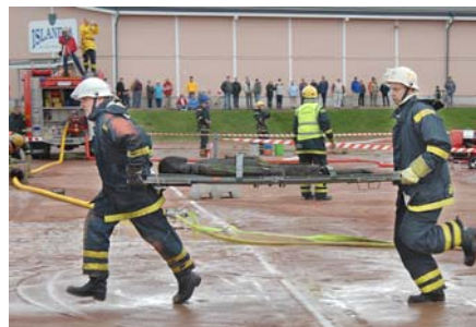
Tävlingarna vid Idrottsparken