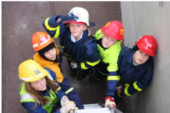
Ungdomar på läger i Lemland

Förbundets lokala läger hölls 13 – 15 oktober på Valborg i Lemland Söderby. 110 personer, ungdomar och ledare mötte upp för en helg i brandkårsarbetets tecken. Med så många deltagare var det tämligen fullt hus på Valborg men ett tiotal ungdomar huserade på Lemlands FBK station där lägerbrandkåren var placerad. Stort tack till lokalarrangören Lemlands FBK och deras ungdomsledare samt tack till alla andra ledare för ännu ett lyckat läger.