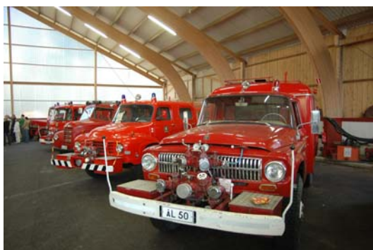
Vy från utställningen

Nya Brandkårmuseet öppnade den 1 juni hos Familjen Häger i Hammarland Mörby. Före flyttningen installerades ett nytt brandalarm i lokalerna. Arbetet med installation av brandalarmet genomfördes på en talka den 25 mars, vid talkan deltog 12 personer. Flyttningen av museets inventarier till Mörby gjordes den 1 april med hjälp av talkoarbete. Till flyttningen kom ca 15 personer från olika medlemskårer. Brandkårmuseet invigdes av Tf Landskapsantikvarie Viveka Lönn Dahl den 9 maj. Till invigningen kom ca 60 besökare. Mariehamns FBK:s orkester stod för musiken vid invigningen. Under år 2006 har museet besökts av 2686 personer mot 2485 föregående år.