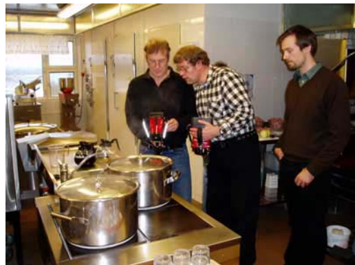
Föreläsning om värmekamera