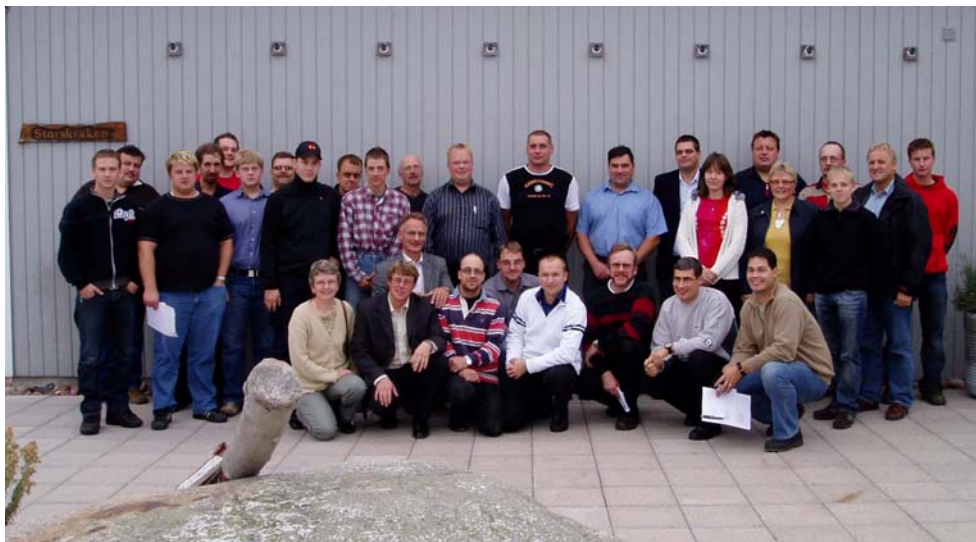
Deltagarna vid seminariet på Havsvidden